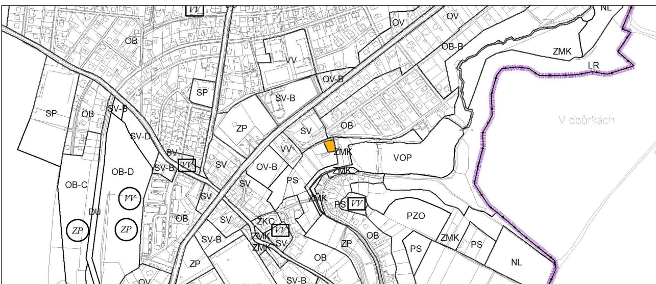
Zákes zadání změny schválený usnesením ZHMP č. 25/33 ze dne 30. 3. 2017